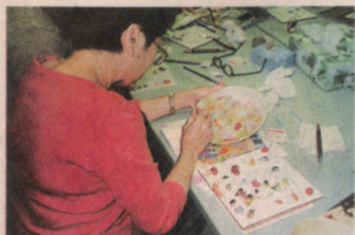
▼ 學員小心翼翼地填上顏料，流露對自家作品的認真與喜悅