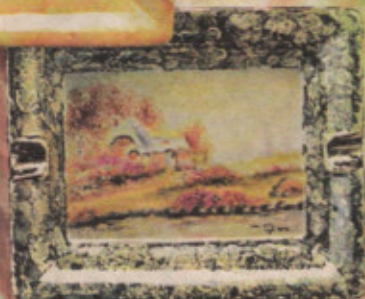
Wong Wai Chu